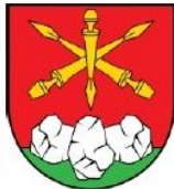
GMINA TOMASZÓW LUBELSKI