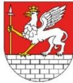
MIASTO I GMINA LUBYCZA KRÓLEWSKA