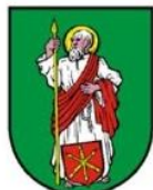
MIASTO TOMASZÓW LUBELSKI